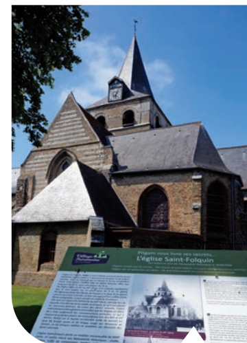
Église St Folquin à Pitgam