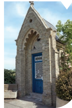
Chapelle de Biere

ATTENTION certaines routes sont fréquentées, soyez prudents !