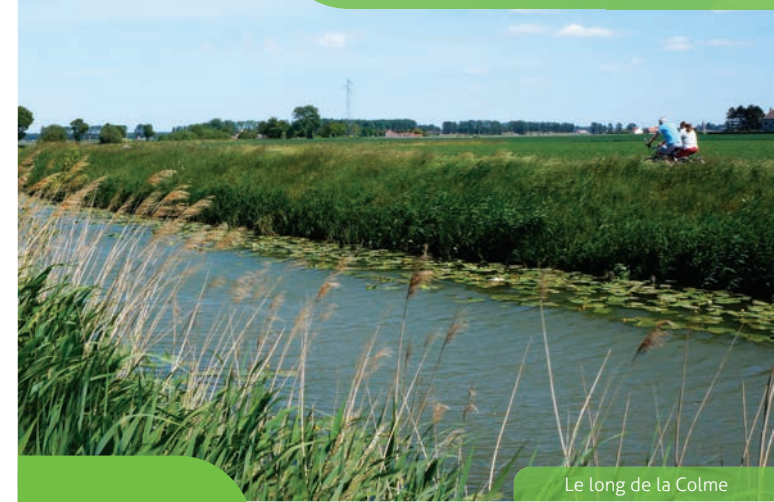
Le long de la Colme

Autour de Bergues et Pitgam Omgeving Bergues en Pitgam